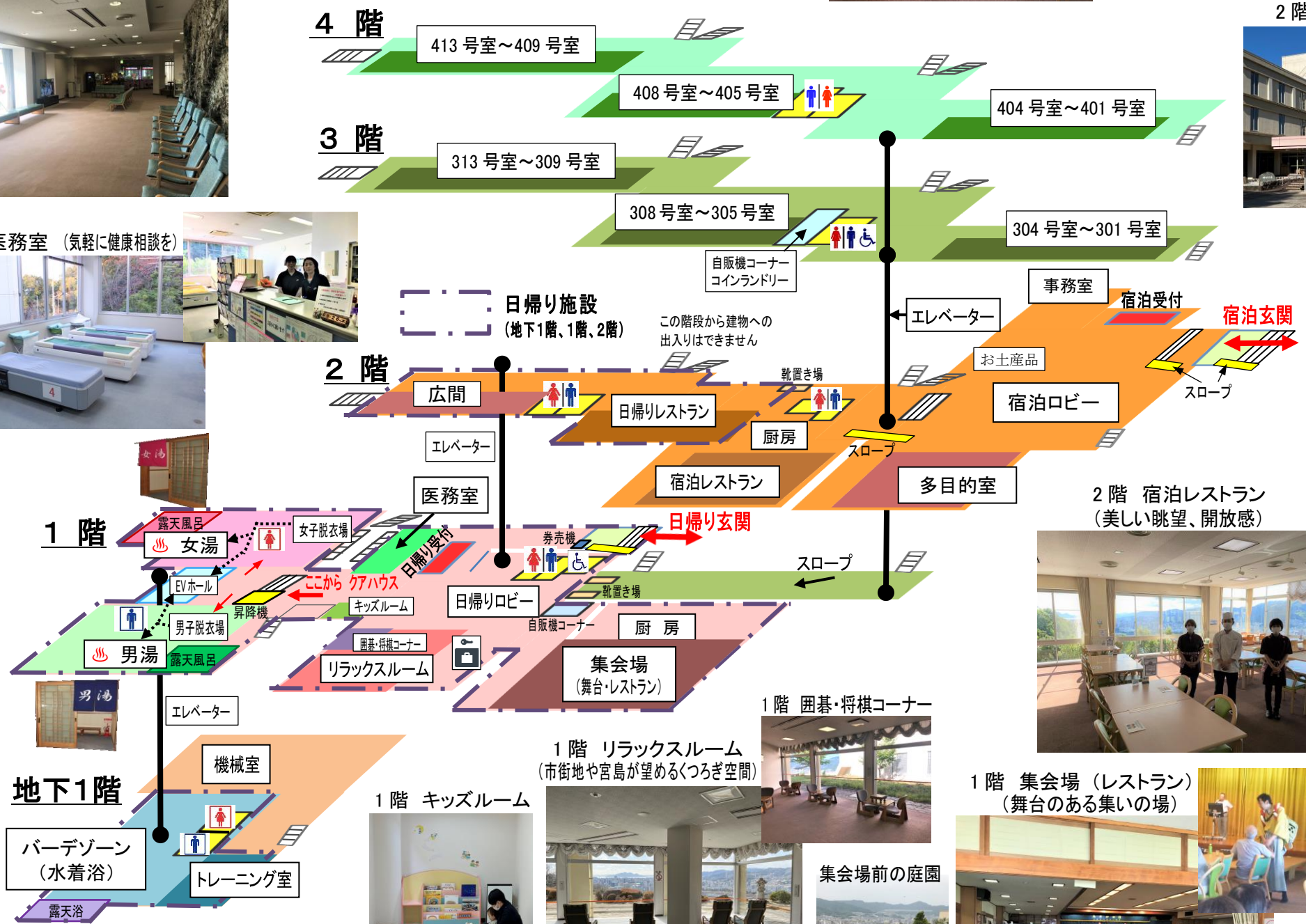
地下1階 バーデゾーン (水着浴) (運動浴、半身・全身浴、圧注浴、気泡浴、露天浴、ミストサウナなど)